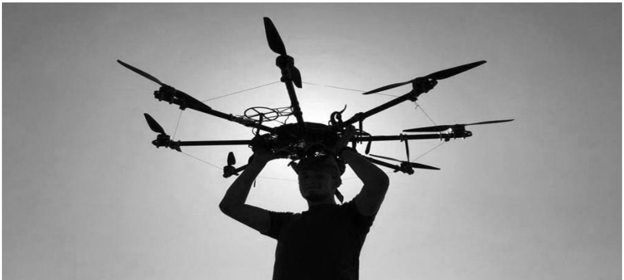
Figura 2- Membro da Aerorozvidka, unidade especializada em ataques por drones, formada por voluntários ucranianos.

Esse grupo, que conta com 50 esquadrões de pilotos de drones, vem utilizando não somente aeronaves propriamente militares, mas também aparelhos de vigilância comercial, caseiros de uso civil e muitos reaproveitados por uma indústria doméstica de produção de drones. Organizações voluntárias da Ucrânia unem esforços no mesmo propósito. A Figura 2 ilustra um membro do grupo Aerorozvidka portando um drone adaptado para cumprimento de missão militar.